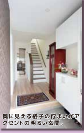
奥に見える格子の行まいがアクセントの明るい玄関。

【施主さまのお声】 リフォームでここまで変えられるのか、ということにまず驚きました。毎朝キッチンに立ってリビングを見渡す度にとても幸せな気持ちになります。訪れた親戚や友人が居心地の良さに感心してくれるのも嬉しいですね。窓をはじめ、きちんと断熱化してもらえたお陰で冬も快適に過ごせています。エコキュートにしたことで光熱費もお得になりました。