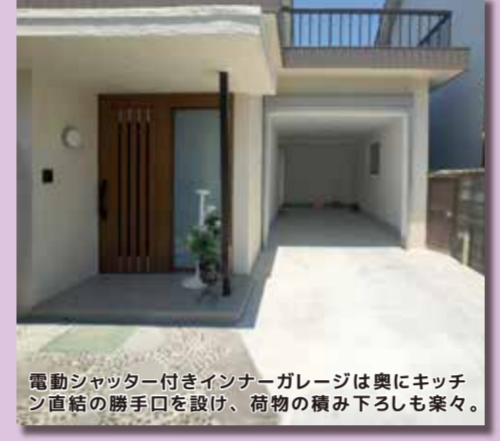
電動シャッター付きインナーガレージは奥にキッチン直結の勝手口を設け、荷物の積み下ろしも楽々。