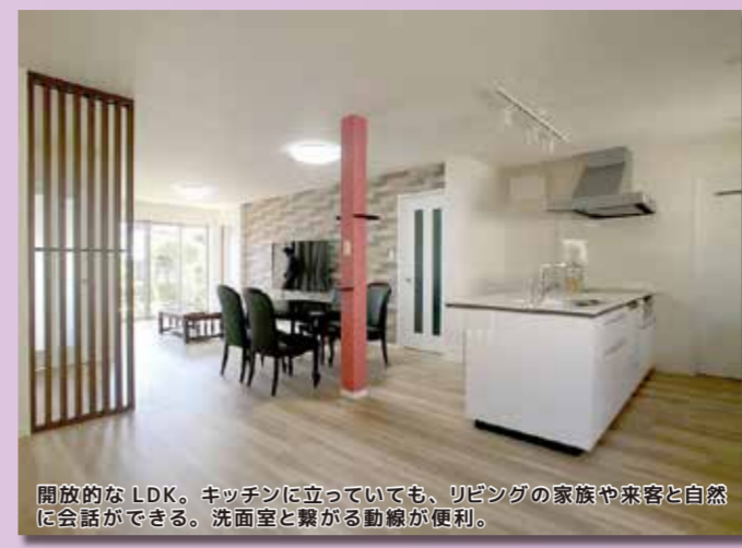
開放的なLDK。キッチンに立っていても、リビングの家族や来客と自然に会話ができる。洗面室と繋がる動線が便利。

After 仏間以外はスケルトン状態からの大規模リフォーム。ブロック塀と洋室を解体して駐車スペース2台分を確保。また、来客が多いとのことでしたので、3つの回遊動線を設けて人の流れが滞らないようにプランしました。全ての窓を防音・断熱性の高いものへ変更し、水廻り設備も一新。一年を通して快適にお過ごしいただけるお住まいに生まれ変わりました。