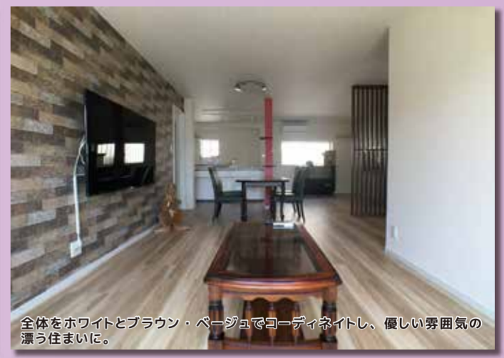
全体をホワイトとブラウン・ベージュでコーディネートし、優しい雰囲気の漂う住まいに。