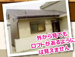
外から見てもロフトがあるように見えません